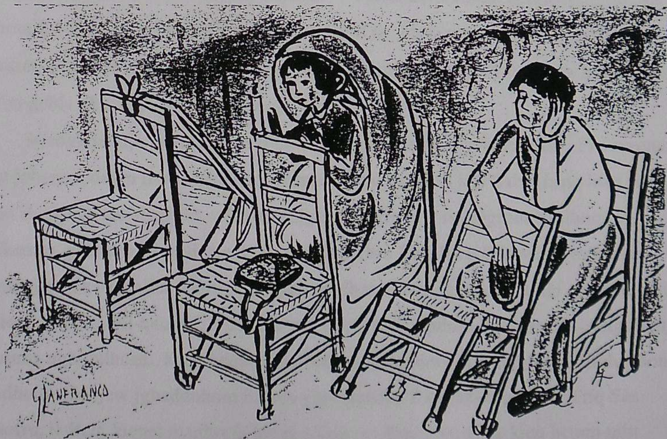
Is-siġġijiet tal-knisja (ara l-faċċata li jmiss)