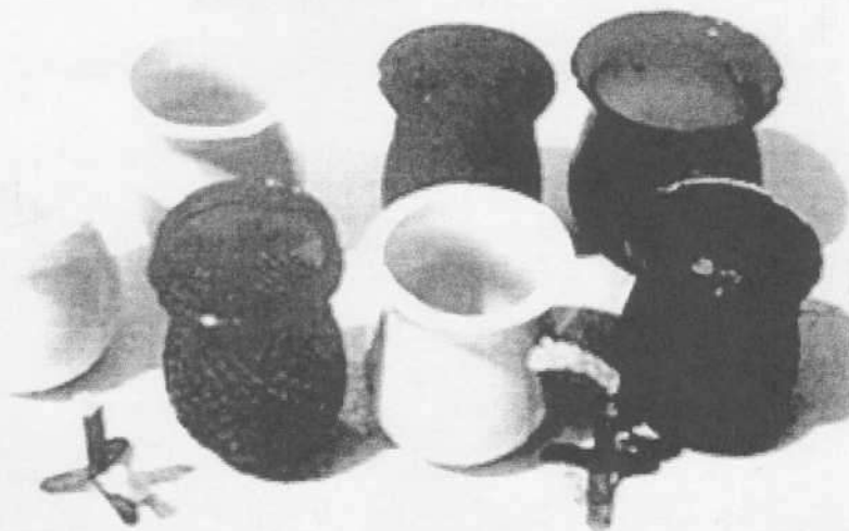
Tazzi taż-żejt u żewġ ċimblori bil-

Dawn kienu jkunu ta' xi għaxar centimetri għoli. L-ilwien kienu minn kullma tista' timmagina. Kien hemm tazzi trasparenti u oħrajn opaki u kienu jkunu għal kollox lixxi jew b'xi disinn imqabbez. It-tazzi kienu fil-maġġoranza tagħhom kollha bil-qiegħ ċatt, b'hekk jistgħu jiegħfu fuq wiċċ livell, imma kien hawn oħrajn, l-aktar dawk destinati biex jiddendlu f'għamla ta' linef, li kellhom il-qiegħ fit-tond. It-tazzi kien hemm b'żonn li jorbtuom tajjeb