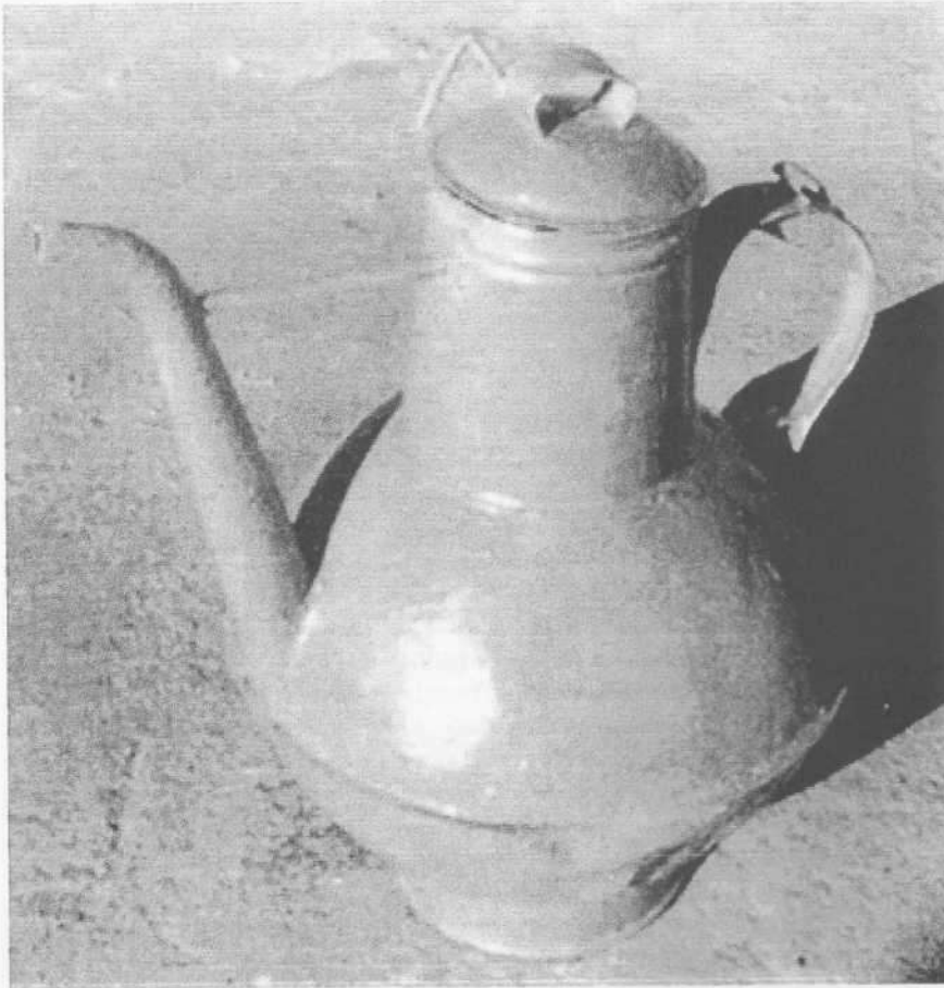
Landa (jew Kanna) taż-Żejt