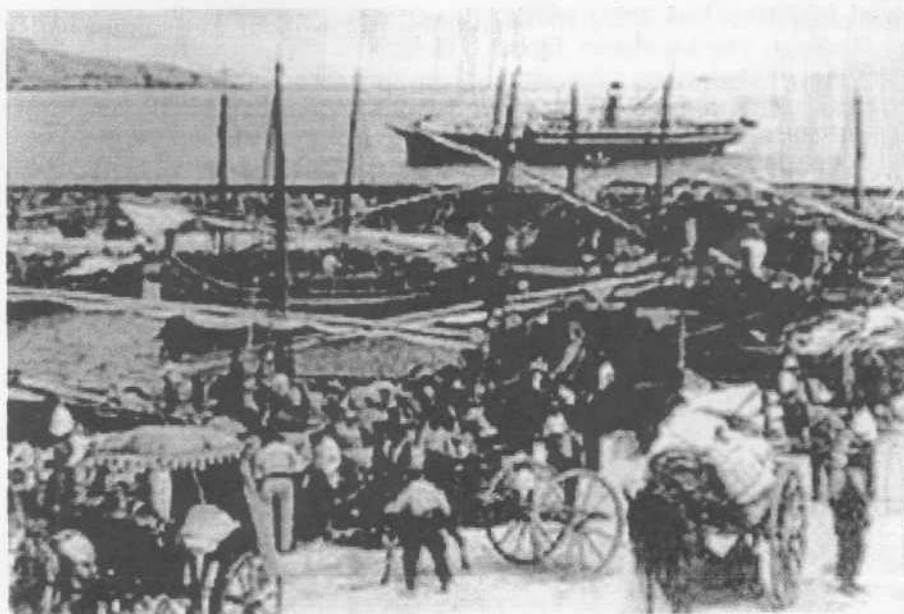
ix-Xatt: il-port tal-Imġarr, Għawdex, għall-ħabta tal-1900

Abela Commendatore Gian Fran Delle Descrizziane Di Malta Agius De Soldanis Gian Piet. Għawdex bil-Ġrajja Tiegħu miġjub bil-Malti minn Mons Dun Ġużepp Farrugia Aquilina Ġuże Papers in Maltese Linguistics Aquilina Ġuże Maltese-English Dictionary Montalto John The Nobles of Malta 1580-1800 Serracino Ingloott Erin Il-Miklem Malti Trump D.H. Malta: An Archeological Guide Wettinger Gofrey Placenames of the Maltese Islands ca 1300-1800