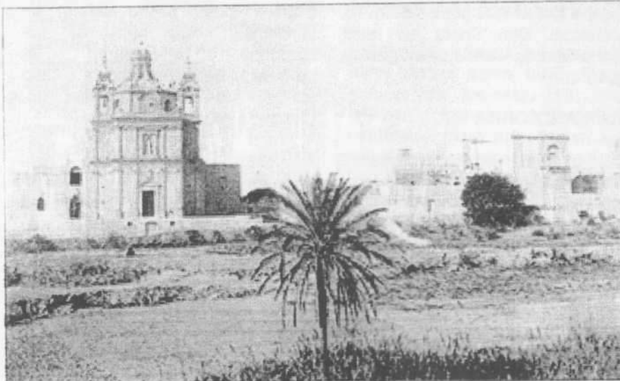
Il-knisja ta' Sant'Antnin ta' Padova -